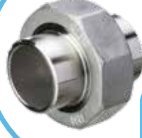
PASLANMAZ DIŞLİ KAYNAKLI KONİK REKOR STAINLESS WELDING CONICAL UNION

Malzeme (Material) : AISI 304 Bağlantı (Connection) : Dişli (BSPP)