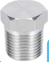
PASLANMAZ DIŞLİ KÖR TAPA STAINLESS HEX HEAD PLUG

Malzeme (Material) : AISI 304 Bağlantı (Connection) : Dişli (BSPP)