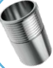
PASLANMAZ DIŞLİ TEK TARAFLI NİPEL STAINLESS WELDING NIPPLE

Malzeme (Material) : AISI 304 Bağlantı (Connection) : Dişli (BSPP)