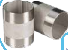
PASLANMAZ DIŞLİ ÇİFT TARAFLI NİPEL STAINLESS BARREL NIPPLE

Malzeme (Material) : AISI 304 Bağlantı (Connection) : Dişli (BSPP)