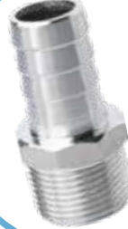
PASLANMAZ DIŞLİ HORTUM REKORU STAINLESS THREADED HEX HORE NIPPLE

Malzeme (Material) : AISI 304 Bağlantı (Connection) : Dişli (BSPP)