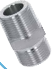
PASLANMAZ DIŞLİ HEX NİPEL STAINLESS HEX BARREL NIPPLE

Malzeme (Material) : AISI 304 Bağlantı (Connection) : Dişli (BSPP)