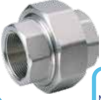
PASLANMAZ DIŞLİ KONİK REKOR STAINLESS THREADED UNION

Malzeme (Material) : AISI 304 Bağlantı (Connection) : Dişli (BSPP)