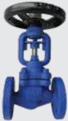
TKC-M16 / M25

Gövde (Body) : JS1049 (GGG40.3) / GS-C25 Körük (Bellows) : Paslanmaz Çelik Klape (Disc) : Konik Basınç (Pressure) : 16 BAR / 25 BAR Konik Sit ve Klape Yapısına Sahiptir. It has a conical seat structure.